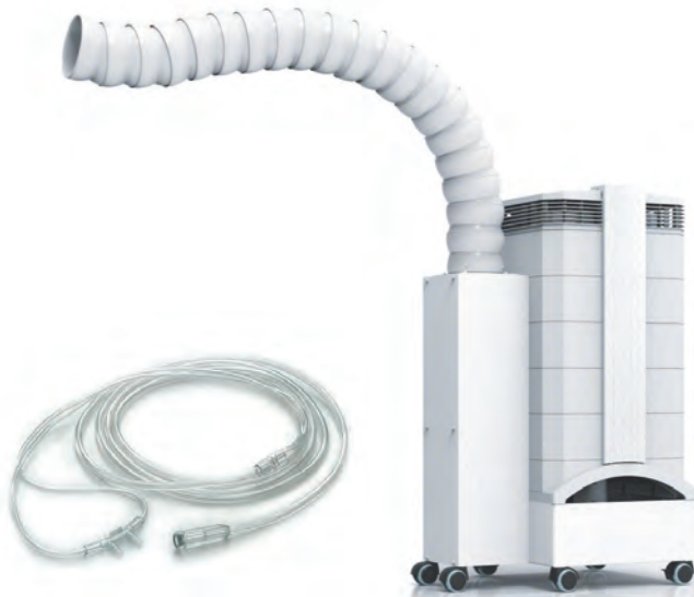
Kofferdamm, Sauerstoff-Zufuhr, CleanUp Sauger, IQ-Air und Mikronährstoffe