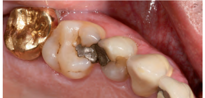
Klassisches Szenario: Goldkrone neben Amalgamfüllung – der Batterieeffekt.

unspezifische Symptome wie Stechen oder Druck in der Brust, unerklärtes Herzrasen, Tinnitus und Hörverlust, etc. sein [50].